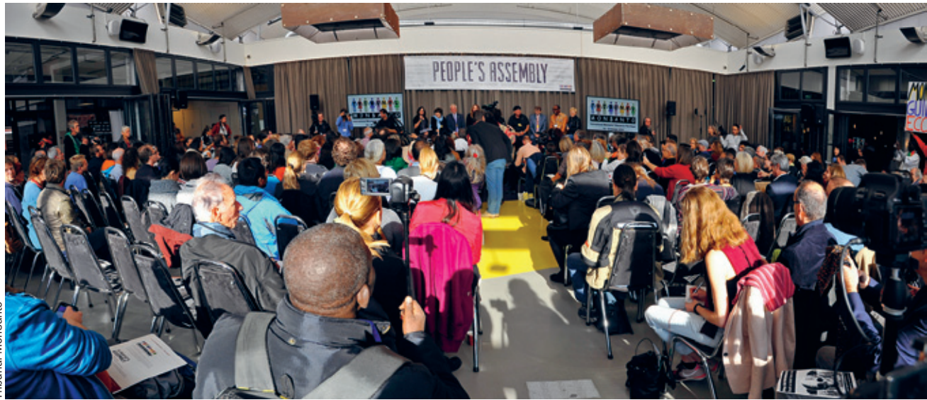
Le Tribunal Monsanto s'est tenu en octobre 2016 à La Haye, aux Pays-Bas. Parallèlement aux audiences menées par 5 juges connus internationalement, une Assemblée des peuples s'est tenue pour débattre des alternatives aux OGM et aux pesticides.

agement important d'un écosystème) dans le droit et les statuts de la Cour pénale internationale (CPI). Lors de son passage à Lausanne pour le Forum sur les matières premières